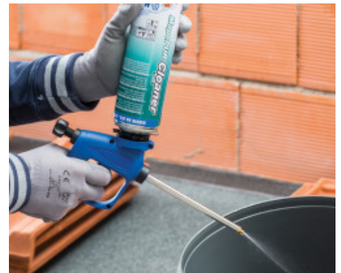
Reinigung einer Pistole / Kartuschenpresse-Sprühdüse