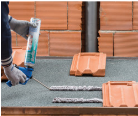
Verklebung von Dachziegeln in Streifen

Sobald die MapePUR Roof Foam G -Dose entleert ist, sofort durch eine neue ersetzen; vor Gebrauch gut schütteln um das Aufschäumen im Inneren der Pistole / Kartuschenpresse zu vermeiden. Zum Ausfüllen von breiteren Hohlräumen (mehr als 5 cm breite Risse) empfehlen wir, mehrere Lagen des Produktes aufzutragen und zwischen jeder Schicht vor dem Auftragen der nächsten Schicht zu warten, bis die vorherige Schicht ausgedehnt ist. Sofort nach der Verarbeitung des Produktes empfehlen wir den Schaum mit Wasser zu besprühen, um einen besseren Ertrag und eine optimale Polymerisation zu erreichen. Einmal erhärtet kann der überschüssige Schaum geschnitten, sandgestrahlt, grundiert, gebohrt, mit zementären Produkten beschichtet und gestrichen werden.